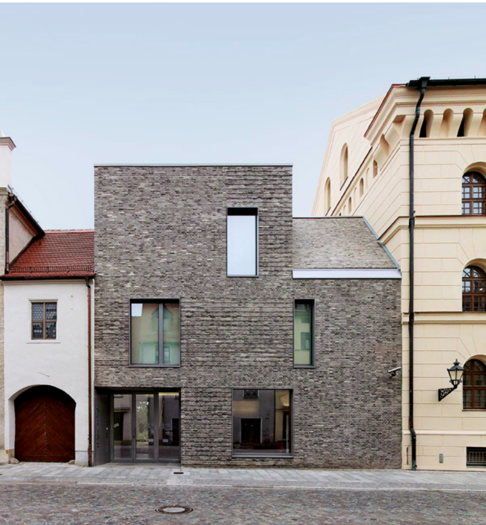
▲ Sensibel im historischen Umfeld verhält sich der Erweiterungsbau des Melanchthonhauses Wittenberg.