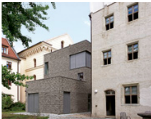
◀ Rückseitig lässt das Gebäude genügend Raum für den Melanchthongarten.